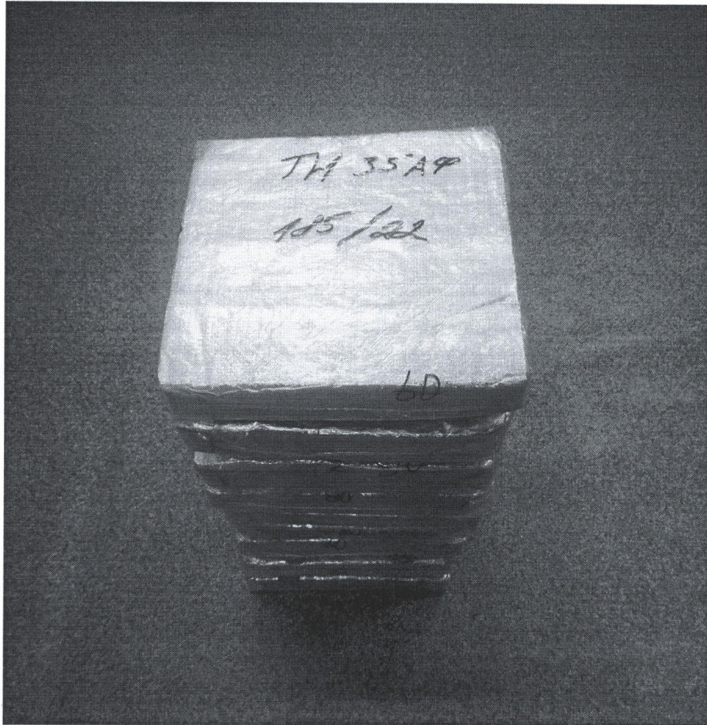
Рисунок 2 – Випробувальні зразки дослідів